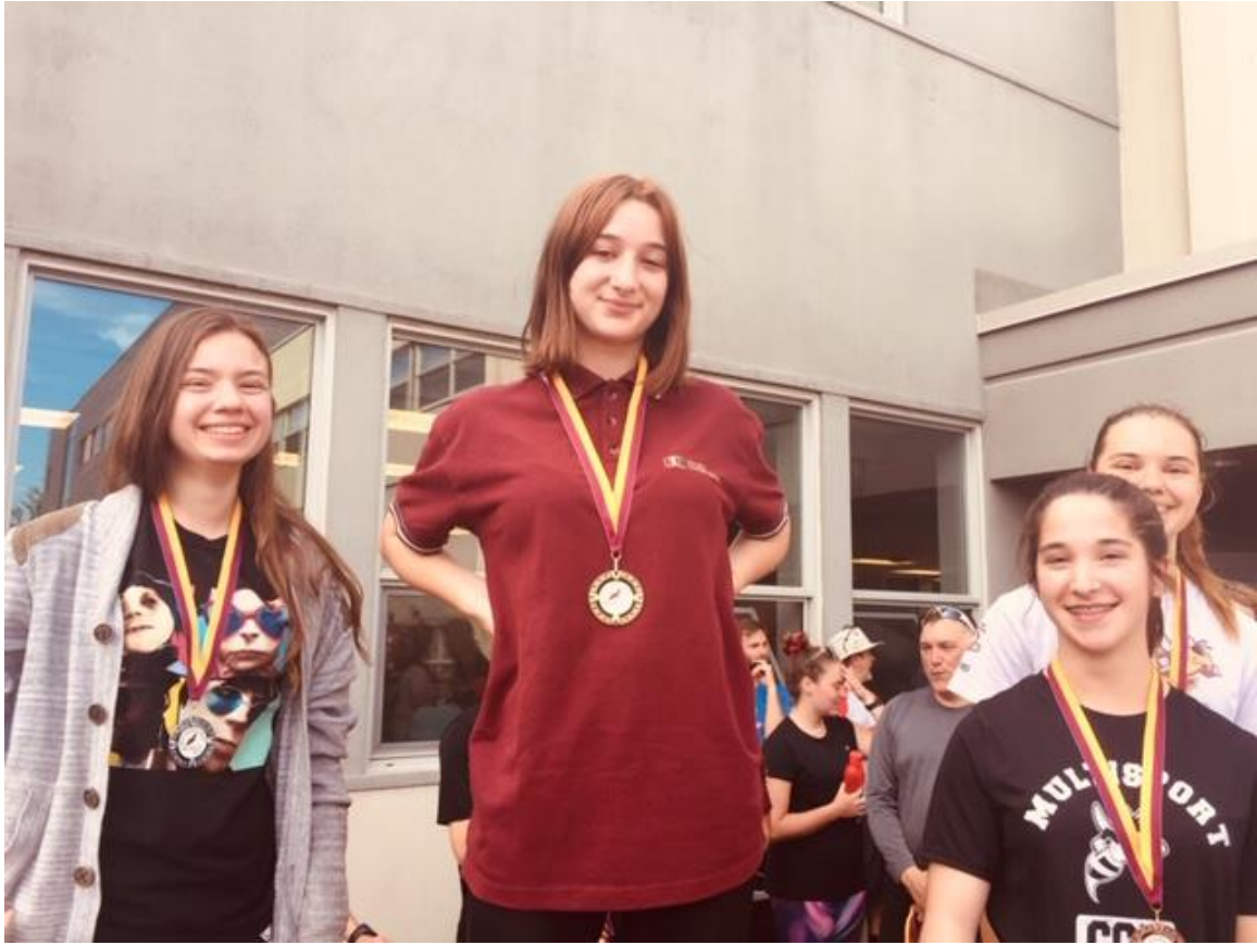
4 ème secondaire filles (4 Km)