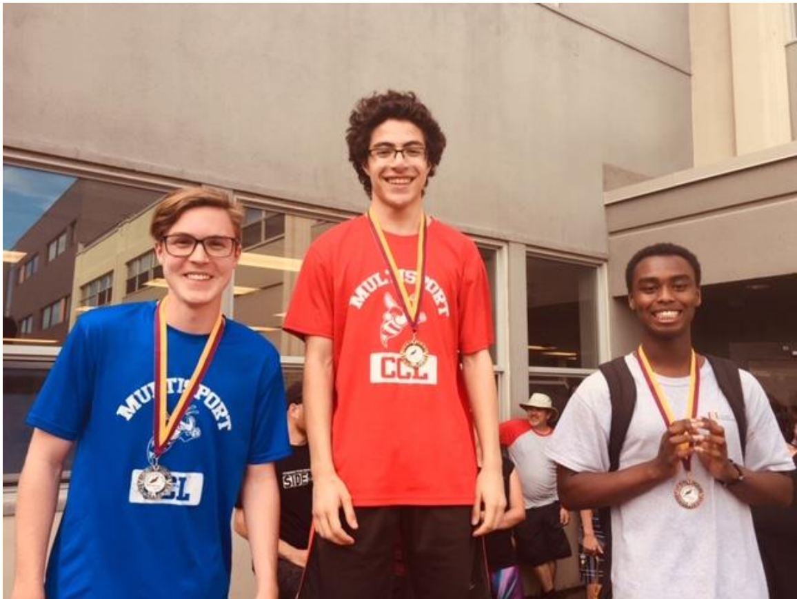
4 ème secondaire garçons (4 Km)