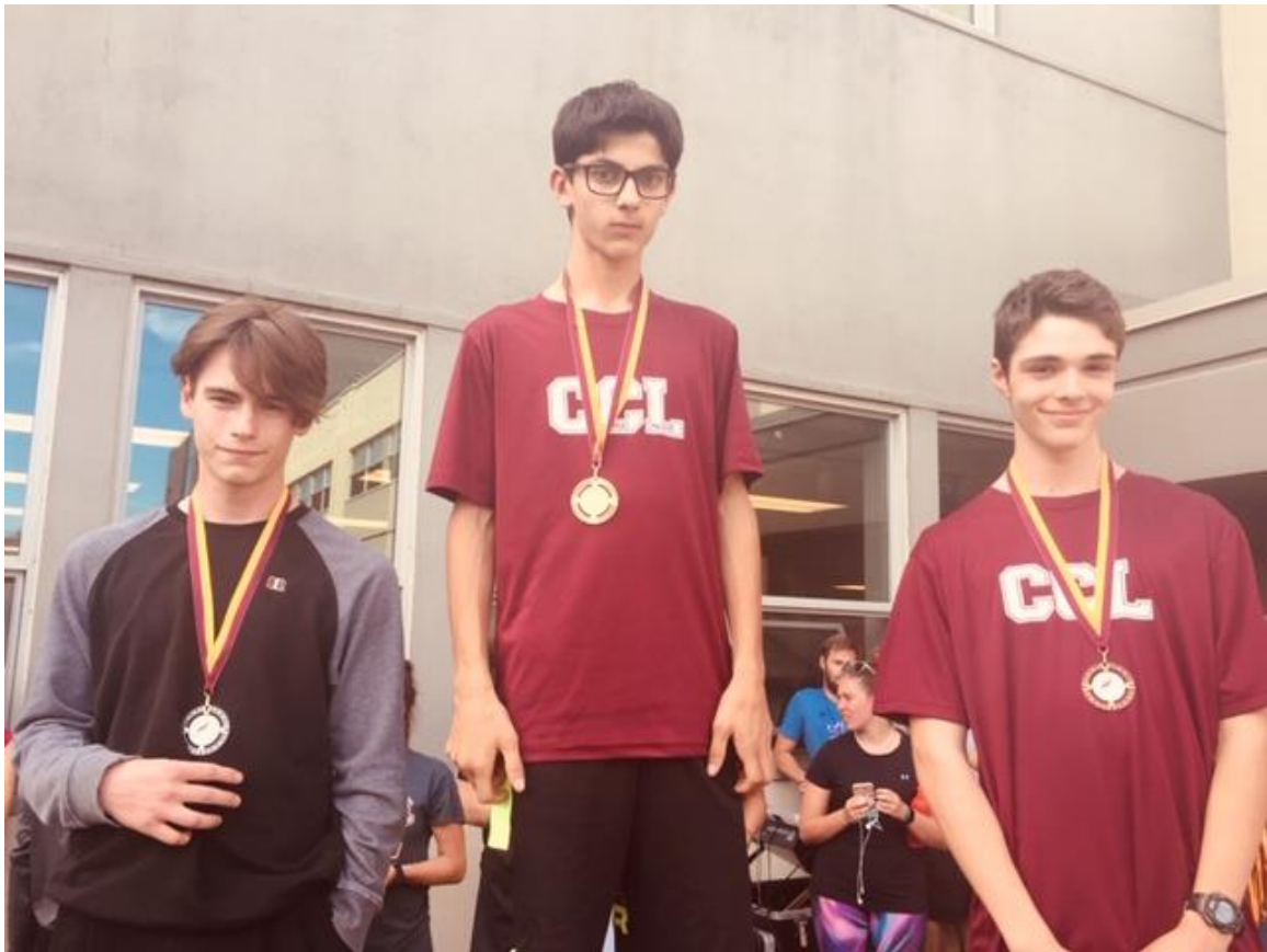
2 ème secondaire garçons (2,4 Km)