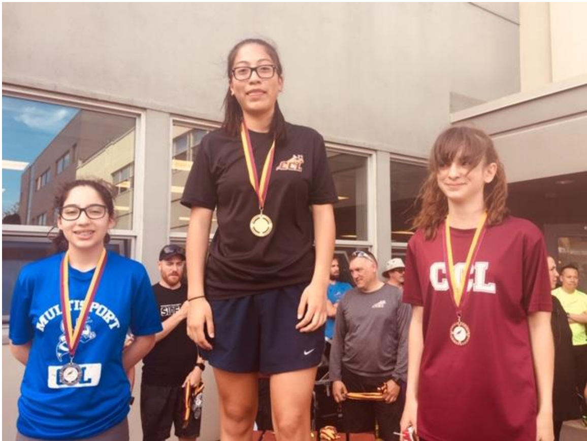
3 ème secondaire filles (4 Km)