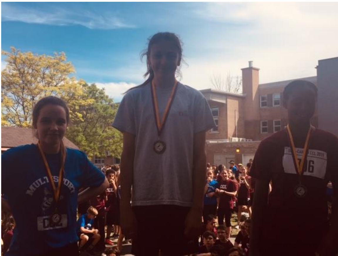
1 ère secondaire filles (2,4 Km)