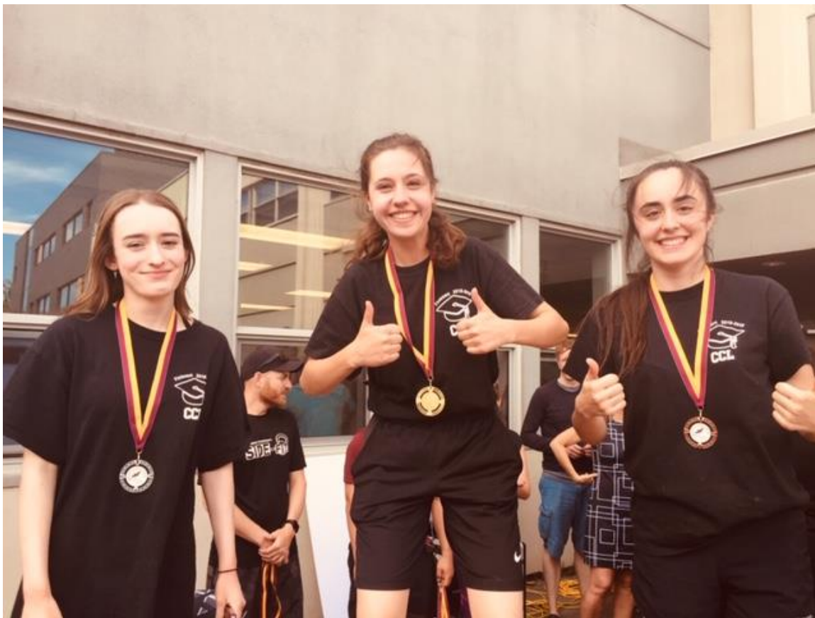
5 ème secondaire filles (4 Km)