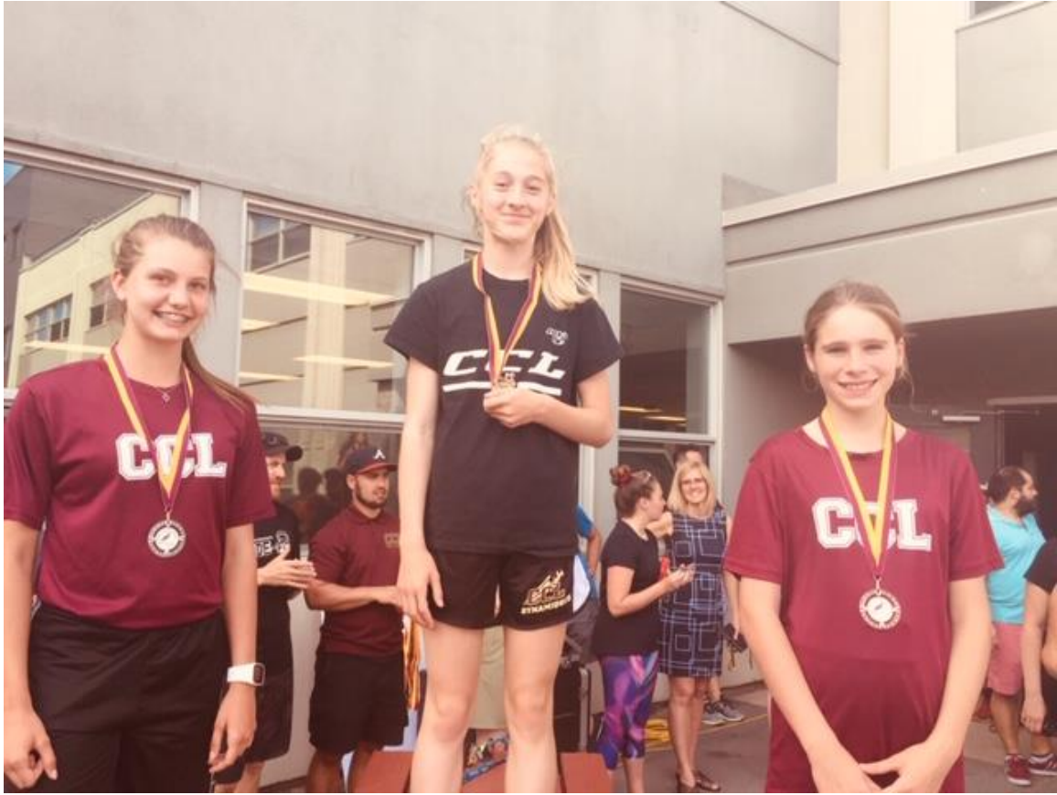
2 ème secondaire filles (2,4 Km)