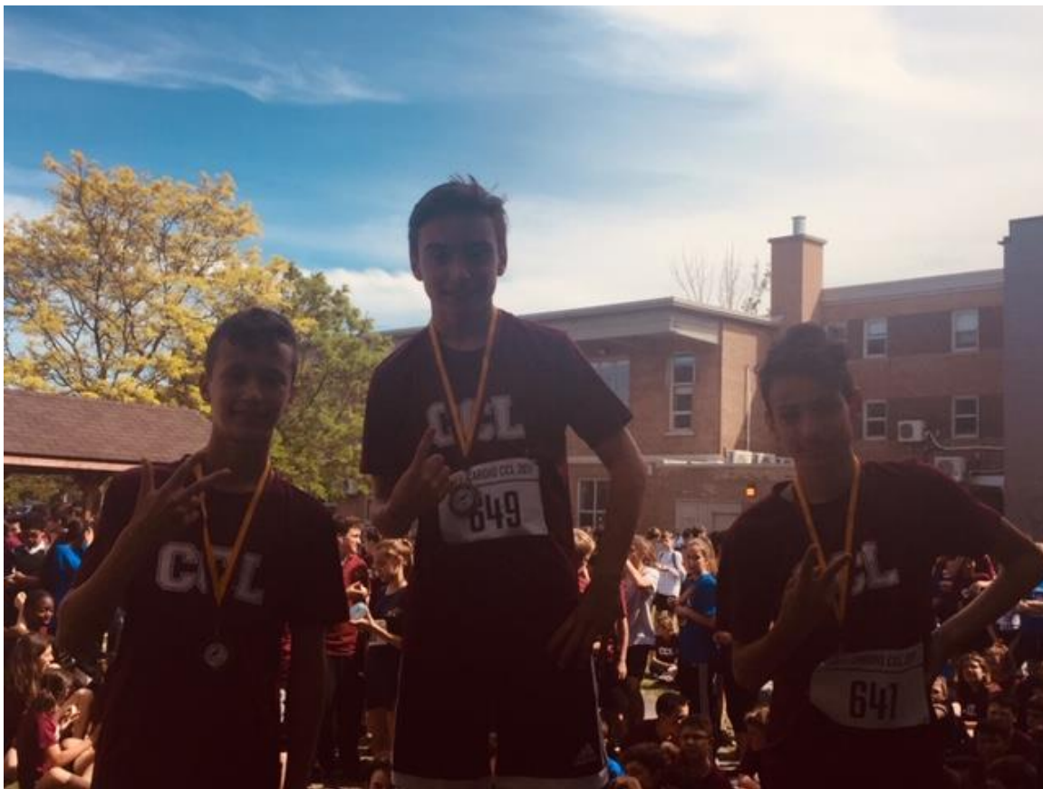
1 ère secondaire garçons (2,4 Km)