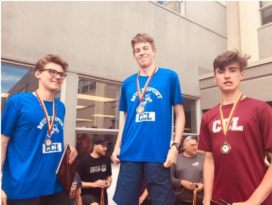
5 ème secondaire garçons (4 Km)