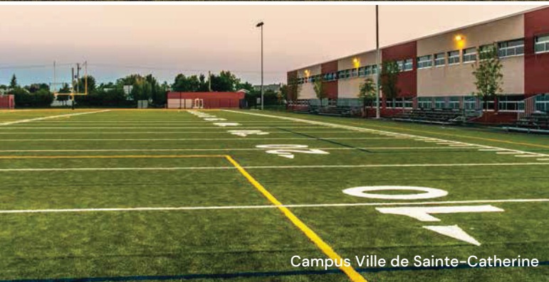
Campus Ville de Sainte-Catherine