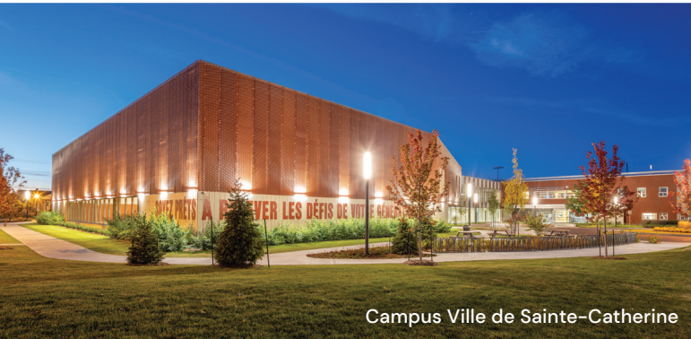
Campus Ville de Sainte-Catherine