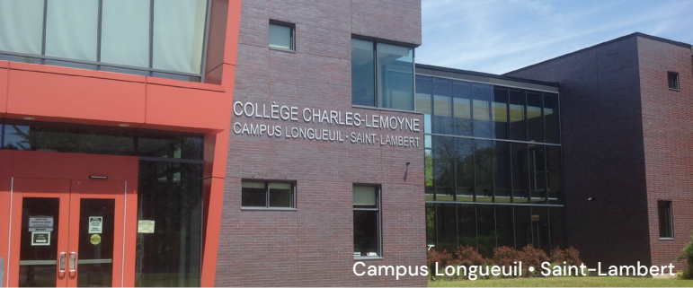
Campus Longueuil • Saint-Lambert