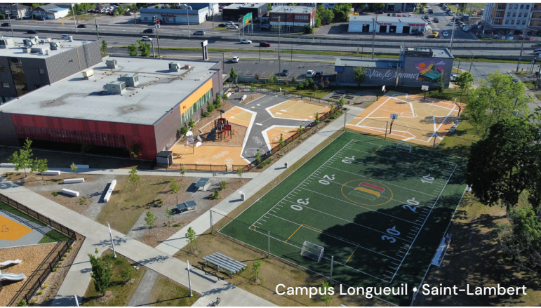
Campus Longueuil • Saint-Lambert